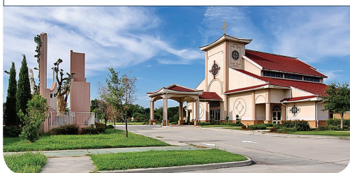
GIÁO XỨ ĐỨC MẸ LA VANG - WWW.LAVANGCHURCH.ORG